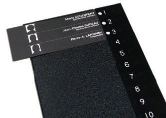
Gabarit de vote en braille avec repères