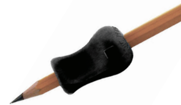
Aide pour marquer votre bulletin de vote