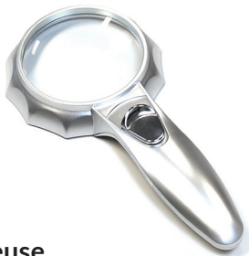
Loupe lumineuse (Grossissement : 4x)