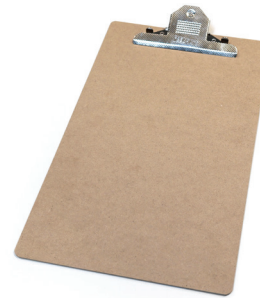
Tablette avec clip

Pour vous aider à voter : demandez la trousse